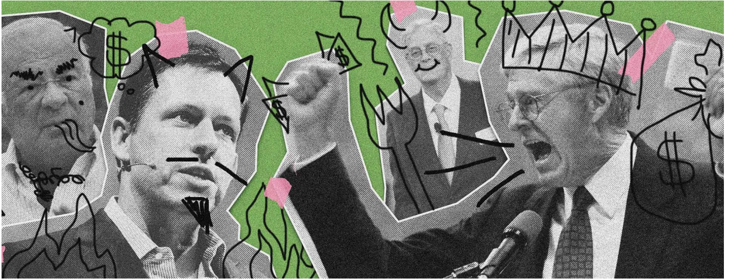
Milliardaires en folie

Le 27 janvier 2021 Par Chuck Collins / Inequality.org https://scheerpost.com/2021/01/27/billionaires-gone-wild-pandemic-profiteering-by-the-numbers/