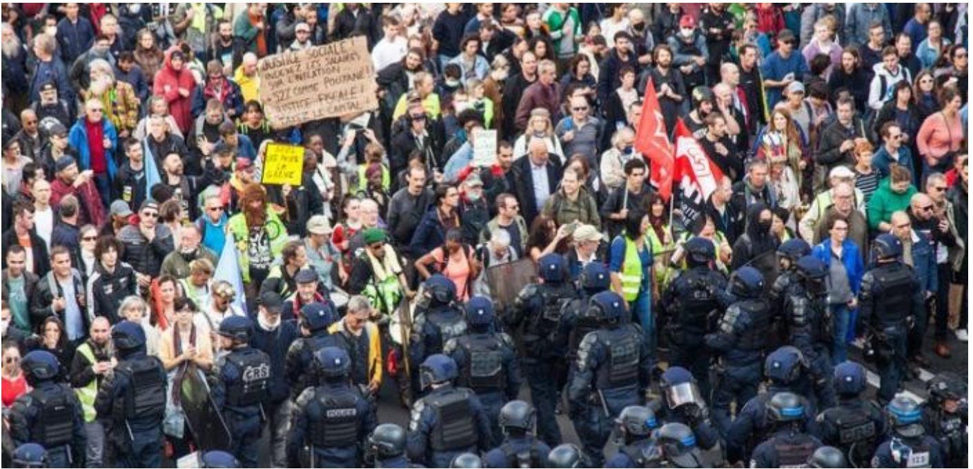
Manifestation et forces de l'ordre

Le coût de la vie, principal problème identifié à court terme par le Forum économique mondial, va-t-il détourner les gouvernements, investisseurs et entreprises des risques à long terme, à savoir la crise environnementale? C'est la crainte des auteurs du Global Risks Report qui, pour sa 17ème édition, appellent les décideurs à répondre à ces polycrises de manière coordonnée.