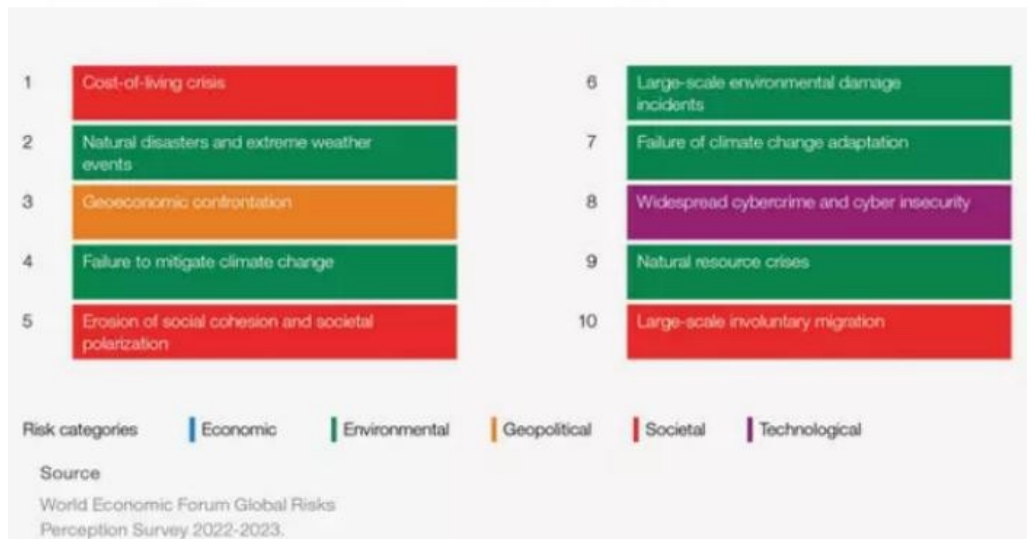
Risques globaux ordonnés par importance sur le court terme (2 ans)