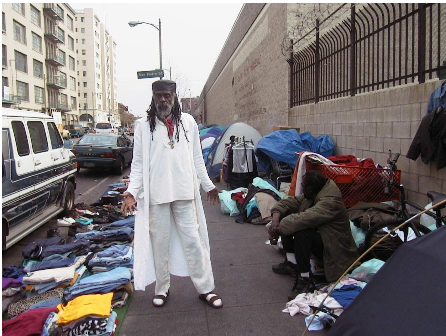
Rue Saint Pierre

La catastrophe a frappé en cinquième année lorsque son grand-oncle, qui tenait le rôle de grand-père, est mort. La stabilité s'est évaporée. Ils ont perdu leur maison. Ils ont déménagé dans une maison délabrée de la rue Hudson. La nuit où ils ont emménagé, elle a pris feu. Ils ont tout perdu. Ils sont retournés squatter leur ancienne maison sans rien. La famille a fini par déménager dans la rue North Park à East Orange. La vie est devenue une série d'expulsions et de déménagements brutaux. Il a été expédié d'école en école. La famille a squatté des maisons abandonnées sans électricité qui étaient aussi des repaires de trafiquants de drogue et de drogués.