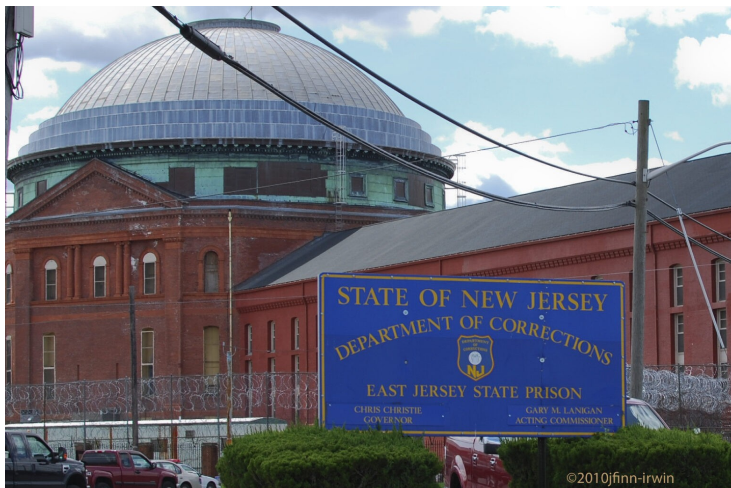
Prison d'État de Jersey-Est