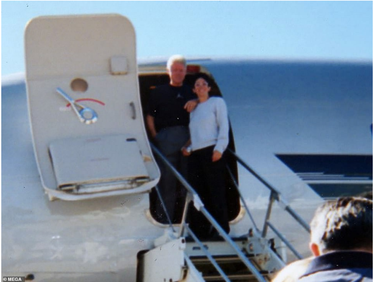
Clinton et Ghislaine ont été photographiés posant ensemble alors qu'ils embarquaient dans l'avion d'Epstein