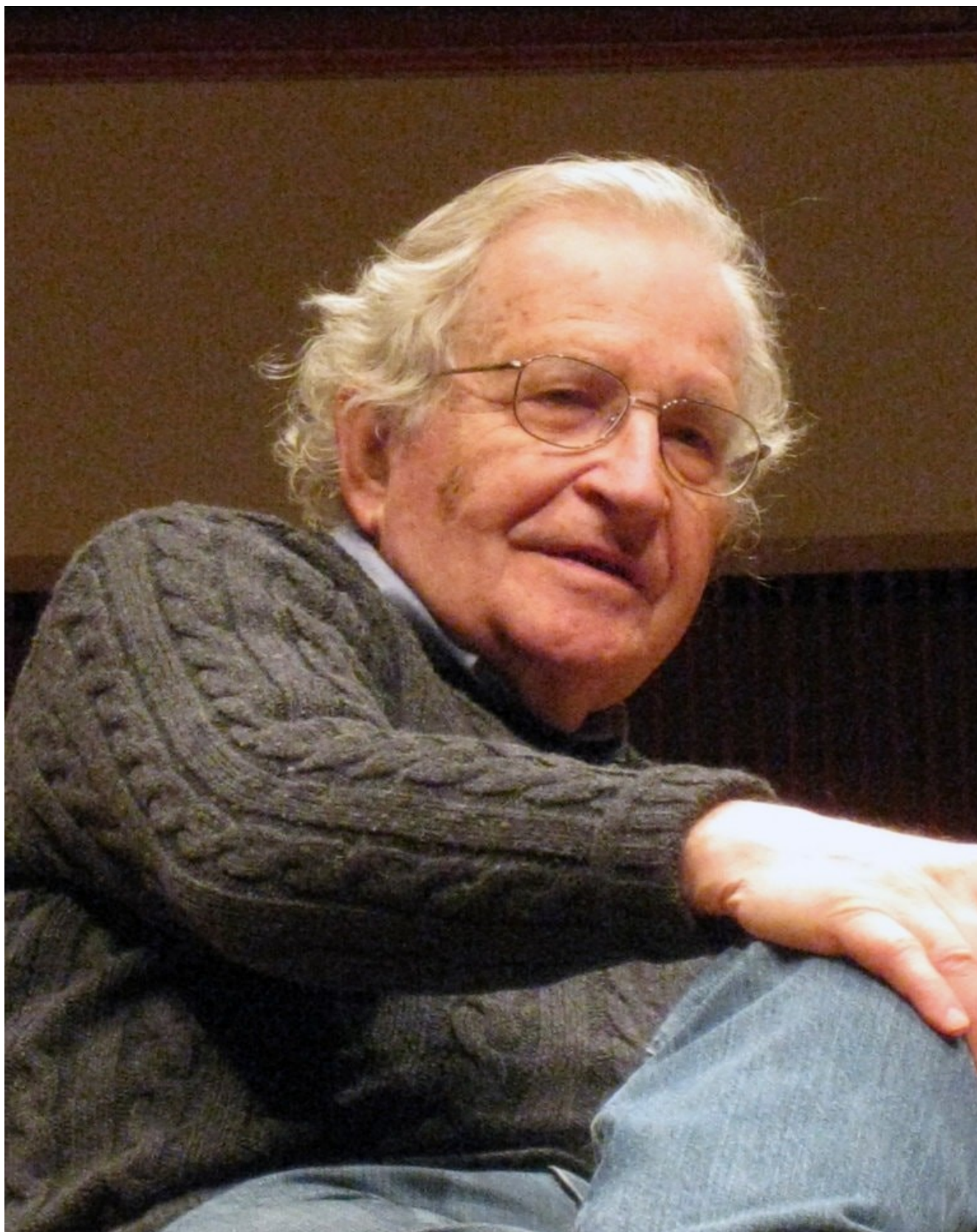
Professeur Noam Chomsky

Entretien avec Sam Tanenhaus le 31 octobre 2016 https://www.nytimes.com/2016/11/06/education/edlife/on-being-noam-chomsky.html