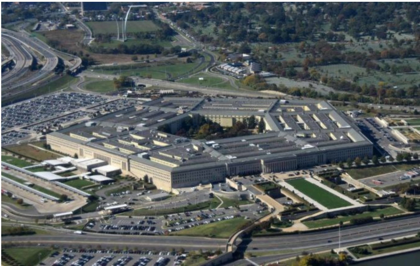
Le Pentagone, siège du Département de la Défense, à Arlington (Virginie) près de Washington DC

menés à des choix peu judicieux concernant les priorités de dépense tant dans notre pays même qu'à l'étranger » lit-on dans la lettre « Pendant ce temps, partout dans le pays, des millions de gens ont perdu leur emploi et leur accès aux soins de santé, alors que la pandémie de coronavirus flambe. Les événements que nous vivons devraient nous forcer à regarder la réalité en face, depuis trop longtemps, nous finançons les mauvaises priorités, utilisons les mauvaises méthodes et adoptons les mauvaises solutions. »