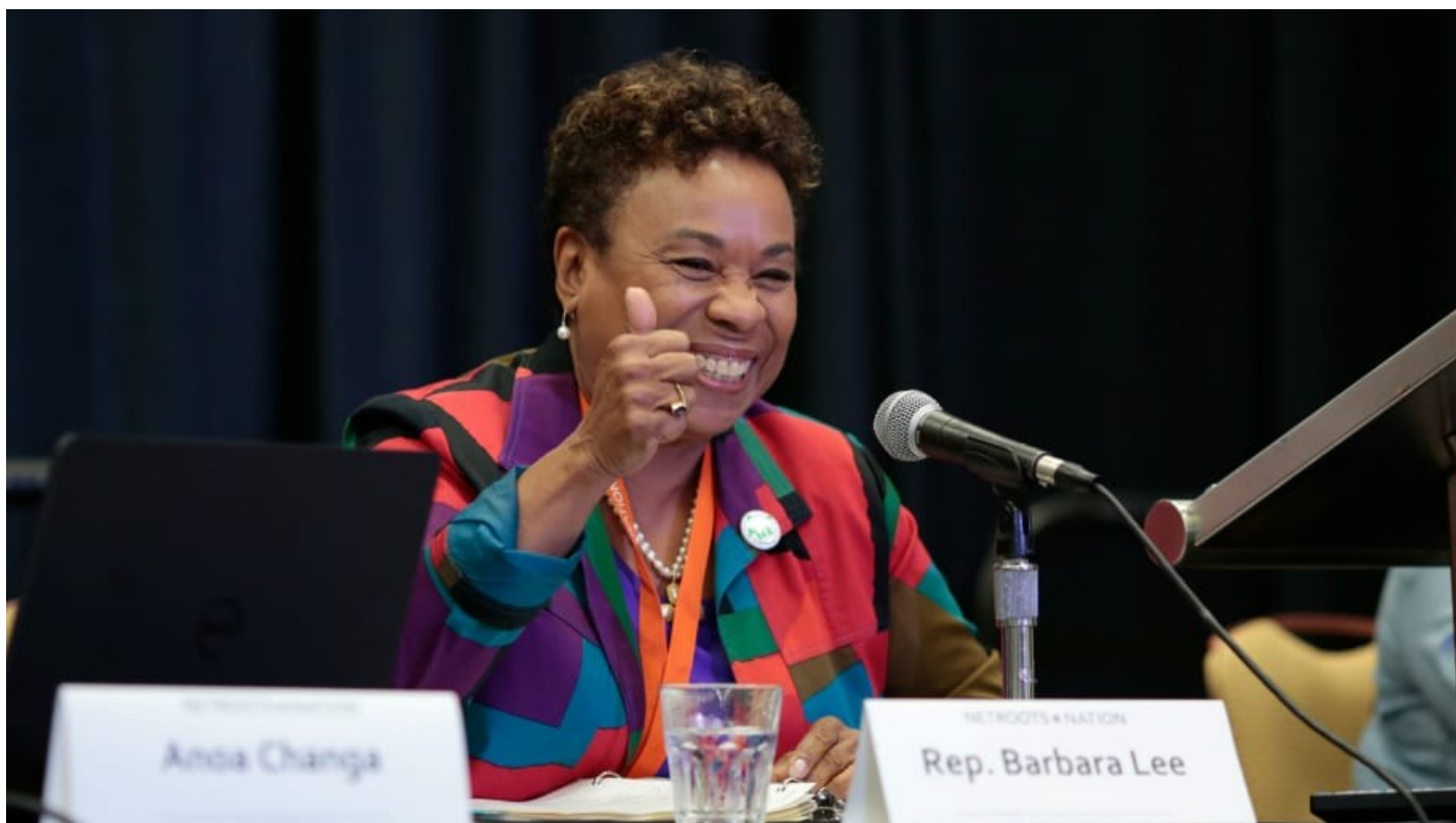
La représentante du Congrès Barbara Lee (Parti démocrate, Californie)

Cette loi budgétaire pour la défense nationale (National Defense Authorization Act (NDAA)), qui est examinée en ce moment au Sénat, prévoit un budget pour l'armée de 740,5 milliards au titre de l'exercice 2021. La semaine dernière, Sanders et le sénateur Ed Markey ( Parti démocrate, Massachussets) ont proposé, par le biais d'un amendement, de réduire cette dépense de 10% et d'utiliser la somme ainsi économisée afin de « créer un programme fédéral ayant pour objet de financer les services de santé, le logement, la petite enfance et l'égalité des chances dans l'enseignement, dans les cités et les villes qui ont un taux de pauvreté de 25% ou plus. »